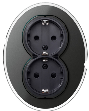
Renova 2-vägsuttag svart glas