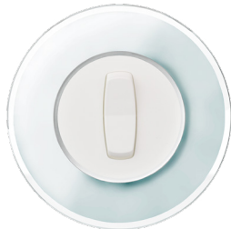
Renova strömbrytare vitt glas