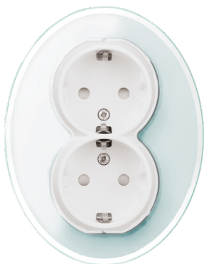
Renova 2-vägsuttag vitt glas