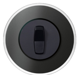
Renova strömbrytare svart glas